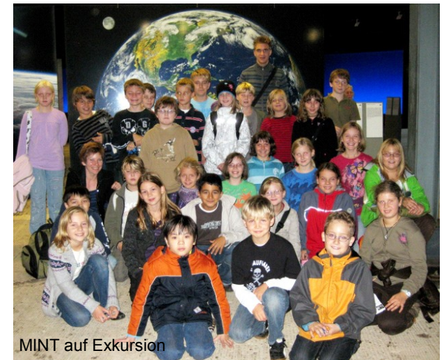
MINT auf Exkursion